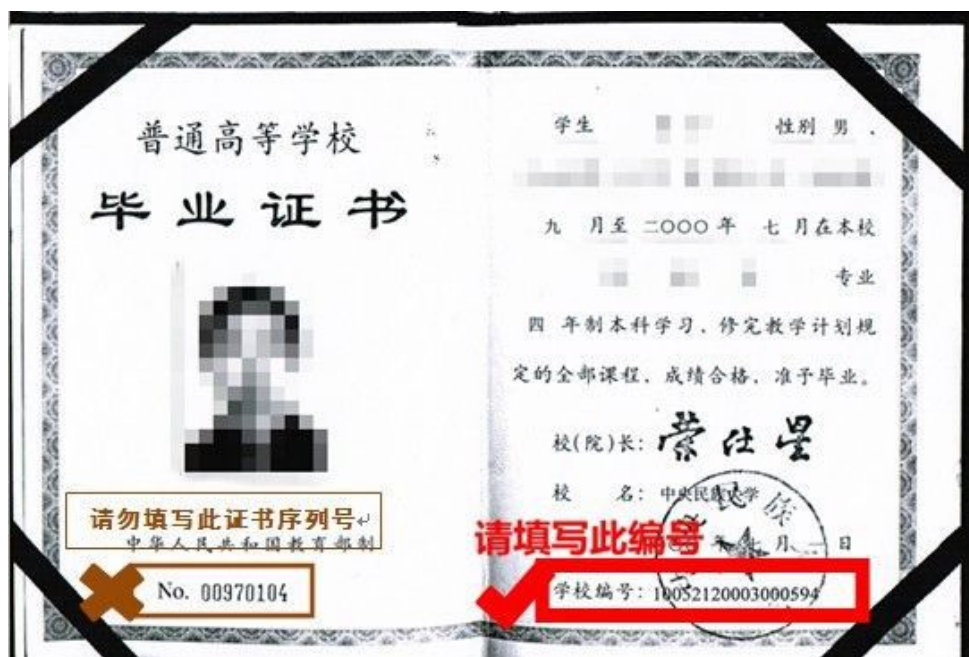
本科毕业证书示例

1. 在学历证书编号栏,按考生获最后学历(硕士、本科或专科层次)的学历证书编号,即毕业证书中的“学校编号”或“证书编号”填写。2001年之后的编号一般大于等于17位,最长18位。